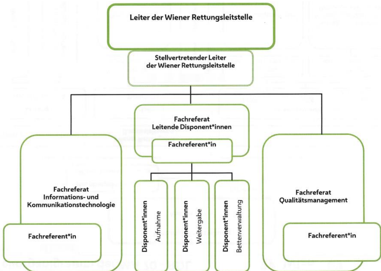
Abbildung 1: Organigramm Wiener Rettungsleitstelle