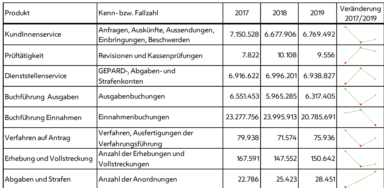
Abbildung 2: Kundinnen- und kundenbezogene Leistungserbringung in den Jahren 2017 bis 2019