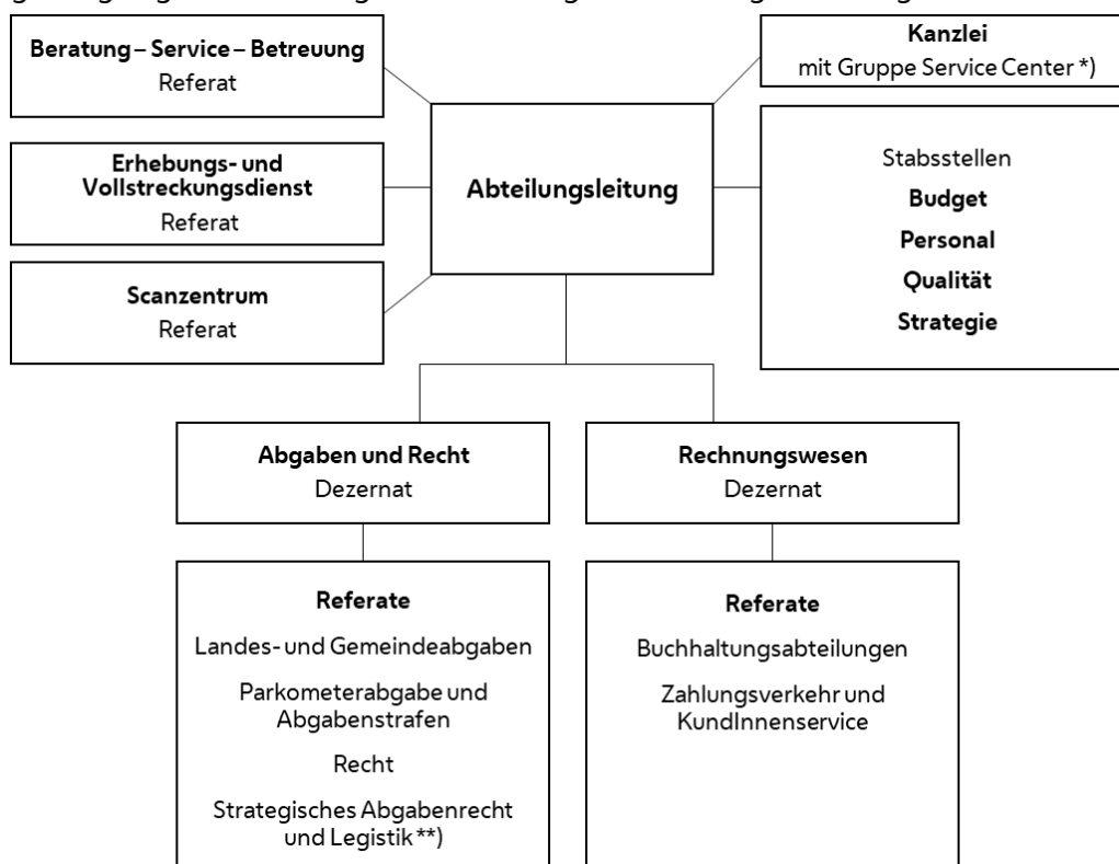
Abbildung 1: Organigramm der Magistratsabteilung 6 - Rechnungs- und Abgabewesen

*) Die Gruppe Service Center wurde mit 1. August 2020 der Kanzlei der Abteilungsleitung zugeteilt.