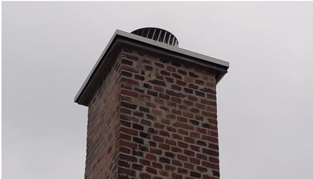
Abbildung 7: Windgetriebener Ventilator am Schornstein