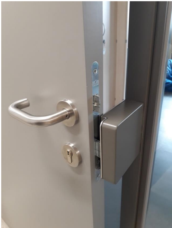
Abbildung 5: Vorrichtung zum Versperren einer Klassentüre mit Spalt