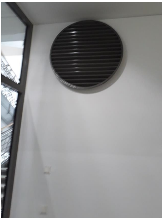
Abbildung 6: Öffnung zum Abluftkamin