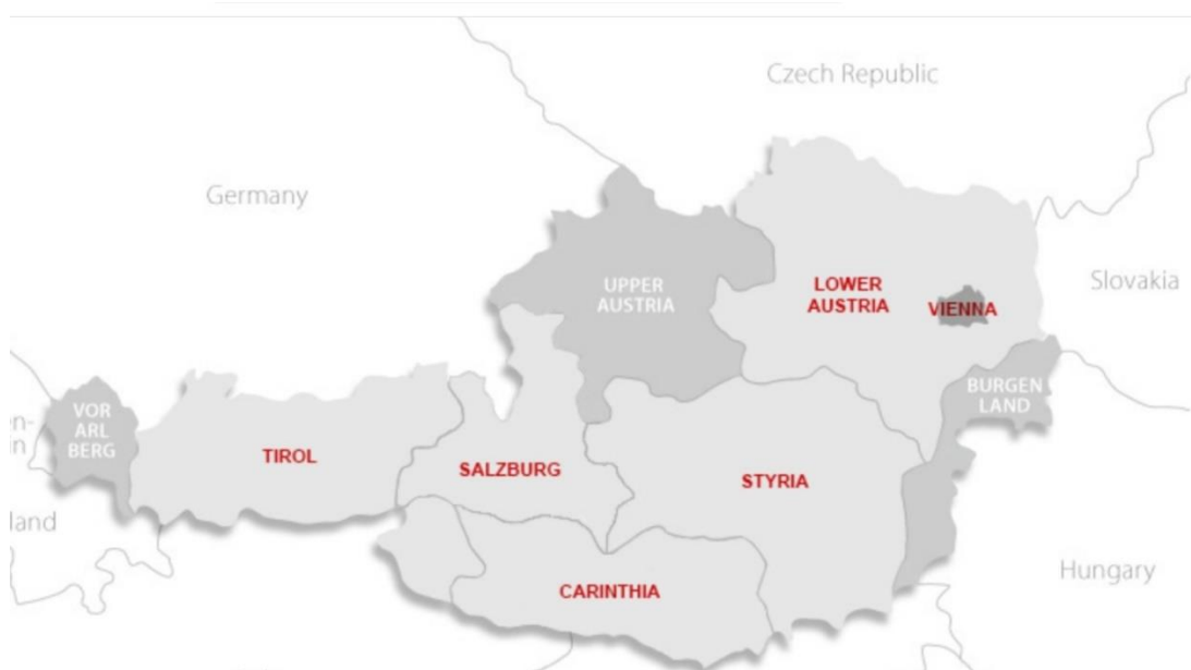
Abbildung 2: Film Commission in den Bundesländern