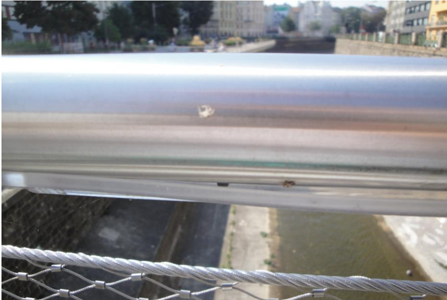
Abbildung 9: Mangelhafte Abdeckung der indirekten Beleuchtung