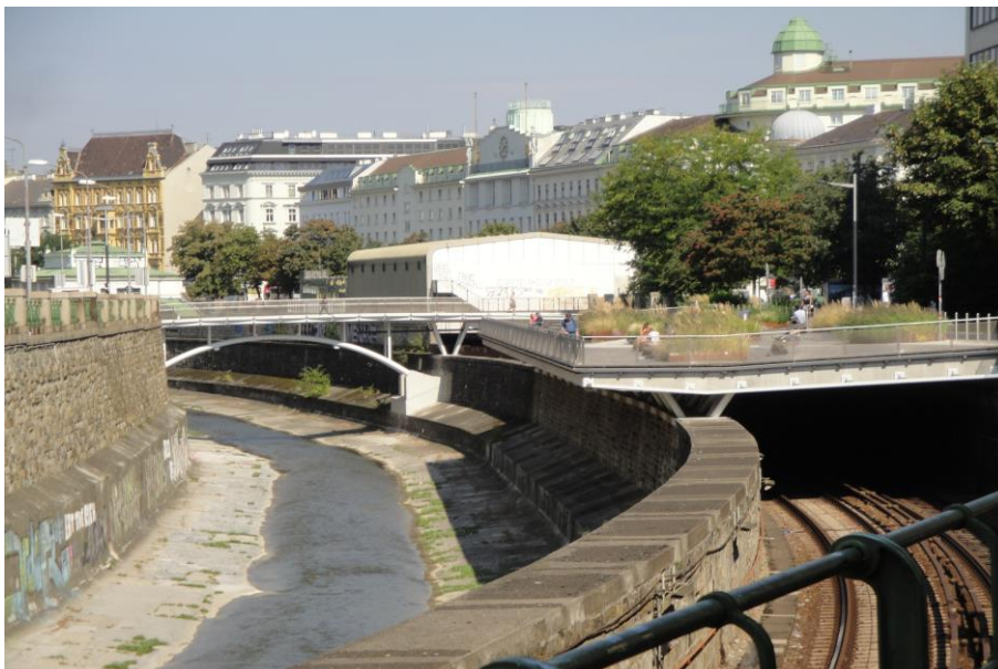
Abbildung 1: Wientalerrasse und Brücke

Im Bereich über den Wienfluss wurde die Brücke als sogenannte Bogenbrücke ausgeführt, wobei zwei tragende Stahlrohnbögen den Wienfluss überspannen. Die Fortsetzung der Brücke über die Bahntrasse der U-Bahnlinie U4 erfolgte über eine vor Ort hergestellte Stahlbetonplatte, wobei die bereits vorhandene Trennmauer, die im Vorfeld statisch ertüchtigt wurde, als Auflager diente.