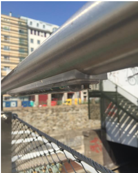
Abbildung 8: Beleuchtung entlang der Absturzsicherung an der Brücke

Der Stadtrechnungshof Wien empfahl daher der Magistratsabteilung 33, die Abklärung dieser Ursache sowie zu prüfen, ob die Behebung der Mängel von der ausführenden Firma im Rahmen der Gewährleistungsfrist durchzuführen ist.