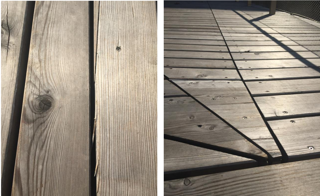
Abbildungen 4 und 5: Unebenheiten am Holzbelag